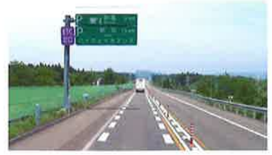
(供用車線の案内標識の移設)