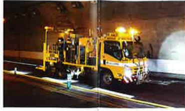
(供用車線の路面標示施工)