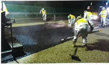
(供用車線の舗装補修)

本工事は、上信越道 信濃町IC～上越JCTの、完成4車線化に向けた準備工事として、供用車線の舗装打換えや設備移設・更新等を行う工事です。