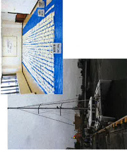
摘発した覚醒剤等

台湾从那覇港に入港したヨットから、覚醒剤約597キログラム、麻薬であるケタミン約631グラム等を摘発しました。