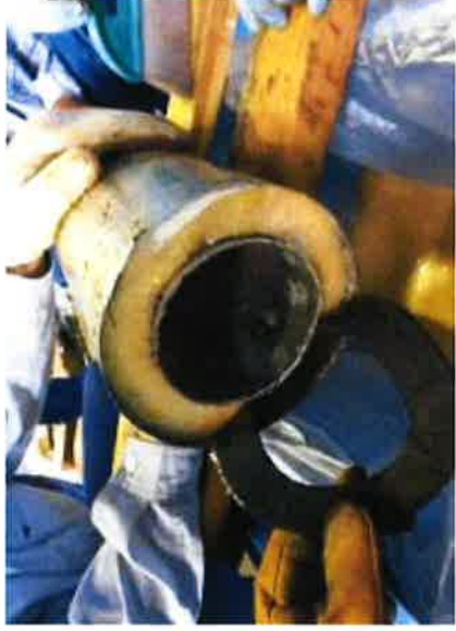
スクラップ内に隠匿

メキシコ合衆国から到着した海上コンテナ貨物から、金属スクラップに隠匿されていた覚醒剤約230キログラムを発見、摘発しました。