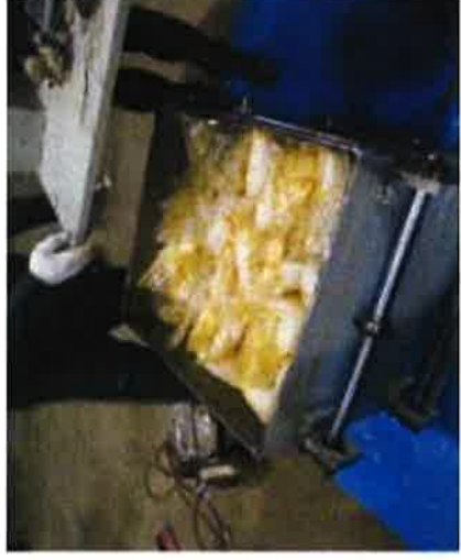
小石運搬機内に隠匿

中華人民共和国から到着した海上貨物から、小石運搬機に隠匿されていた覚醒剤約150キログラムを発見、摘発しました。