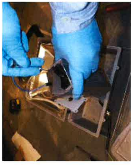
LEDライト駆動装置内に隠匿

中華人民共和国から到着した海上貨物から、LEDライトの駆動装置内に隠匿されていた覚醒剤約150キログラムを発見、摘発しました。