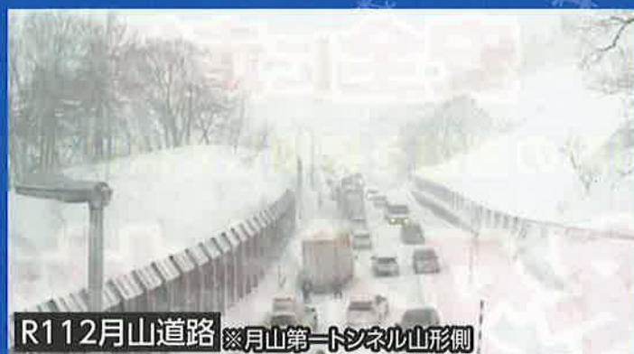
R112月山道路 ※月山第一トンネル山形側