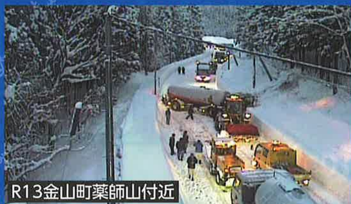
R13金山町薬師山付近