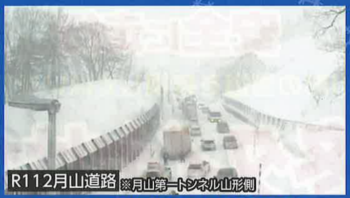
R112月山道路 ※月山第一トンネル山形側