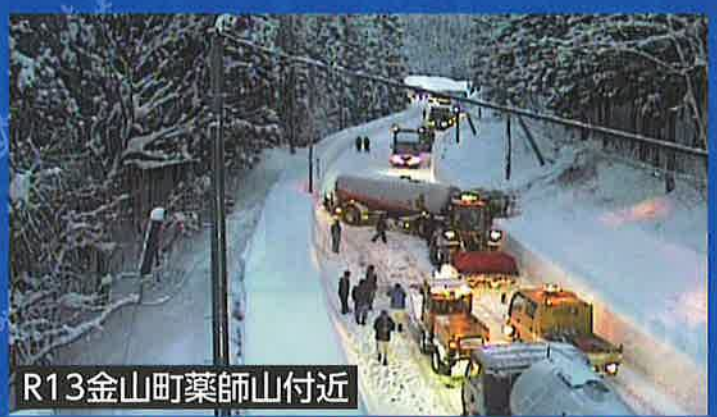
R13金山町薬師山付近