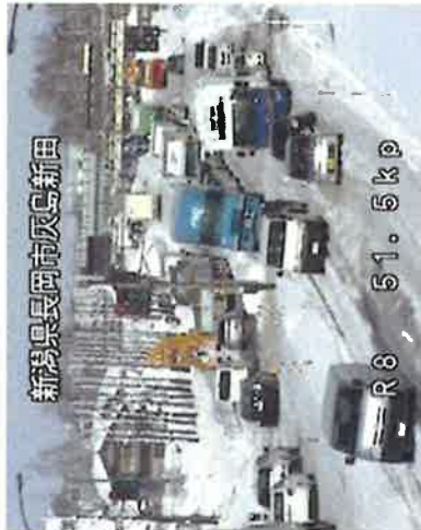
平成28年1月26日(火)12:00頃 長岡市辰巳新田付近の圧雪・渋滞状況

○当該地域の各所で圧雪路面によるスタック車両が発生。並行する高速道路の通行止めや気温の上昇による圧雪路面の悪化が重なり、長時間の渋滞が発生。人流・物流に大きな影響を与えました。